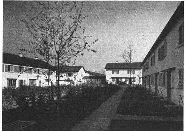
Siedlung Katzenbach (Architekten Sauter & Dirler, Zürich)

Geordnetes Bauen nach einem Gesamtplan. Die einzelnen Häuser nehmen aufeinander Rücksicht. Keines sucht das andere zu übertrumpfen, und durch diese neue Baugesinnung entsteht ein harmonisches Ganzes.