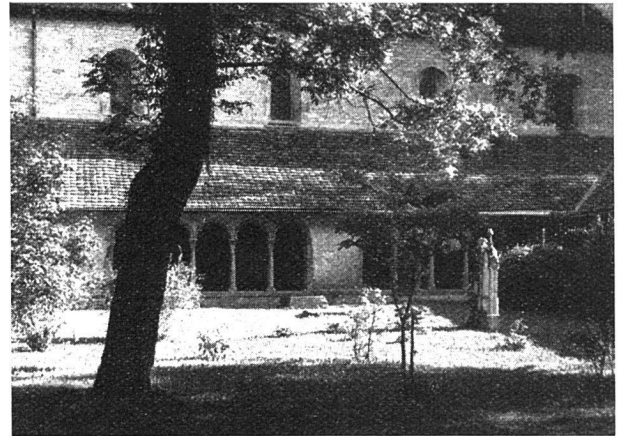
Partie aus dem Kloster Allerheiligen

Verändert hat sich aber seither nicht nur die politische Struktur, sondern auch die wirtschaftliche und soziale. Die Eisenbahnen schafften mühelosere Verbindungen mit dem Innern der Schweiz, aber auch mit unserem nördlichen Nachbarn. Die Wasserkräfte des Rheins wurden durch den initiativen und mutigen Heinrich Moser nutzbar gemacht. Das damals notleidende Gewerbe zog seinen Nutzen daraus und kam zu neuer Blüte. Es entwickelten sich neue Industrien, die Altstadt wurde zu eng, und Gewerbe und industrielle Anlagen siedelten sich mehr und mehr in den Außenquartieren an. Einer falsch verstandenen Großzügigkeit fielen dabei leider eine Reihe unserer prächtigen Tore und Türme zum Opfer. Die Zahl der Einwohner nahm ständig zu. (Heute zählt Schaffhausen etwas über 26 000 Personen.) Es mußten neue Wohnräume geschaffen werden, es entstanden Außenquartiere, und seit der Jahrhundertwende steht Schaffhausen in einer erfreulichen baulichen, kulturellen und wirtschaftlichen Entwicklung. Damit stellten sich viele neue Aufgaben, die teils bereits gelöst oder aber in absehbarer Zeit zu lösen sind: Der Bau neuer Wohnungen, neuer Schulhäuser, Kindergärten, Sportplätze, Museen, Theater, dann aber auch Straßenbauten, Kanalisierungen, Kläranlagen usw. Dabei sind sich die Behörden sehr wohl bewußt, daß trotz all den berechtigten Forderungen der Neuzeit das charakteristische Gesicht der