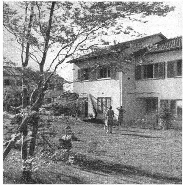
Einfamilienhäuser - Ansicht von der Obsthaldenstrasse