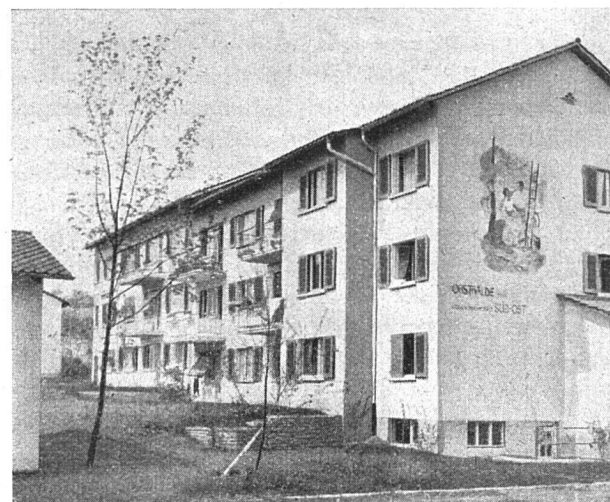
Mehrfamilienhäuser mit «Fresko»