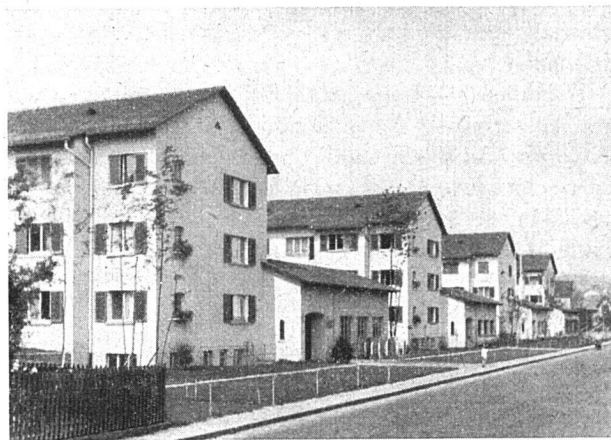
Mehrfamilienhäuser - Ansicht von der Wehntalerstraße

Längs der Obsthaldenstraße, welche im Zentrum der Kolonie zu einem Spielplatz erweitert worden ist, da dieselbe ohne jeglichen Durchgangsverkehr ist, gruppieren sich sechs Einfamilienhaus-Baublöcke mit total 25 Einfamilienhäusern à 4½ und 5 Zimmer. Auch diese wurden bewußt in einfacher Form und Ausführung gehalten. Wie aus den Photos ersichtlich ist, lehnen sich die Baublöcke ringsum an geräumige Grünflächen an, hinzu kommt noch das ansteigende