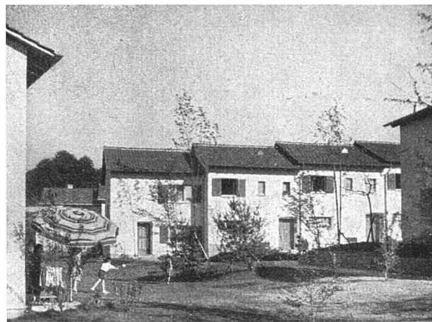
Einfamilienhäuser - Nordwest-Ansicht