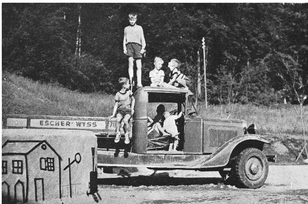
Hauptanziehungspunkt ist ein fahrbereites Auto

Im Gegensatz zum privaten Wohnungsbau, der außer der «Sorge» der Wohnungsvermietung sich um das Wohl und Wehe seiner Mieter nicht weiter bekümmert, obliegen den Genossenschaftsorganen viel weitergehende Verpflichtungen.