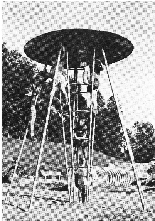
Der «Altra»-Kletterturm ist ein begehrtes Betätigungsobjekt