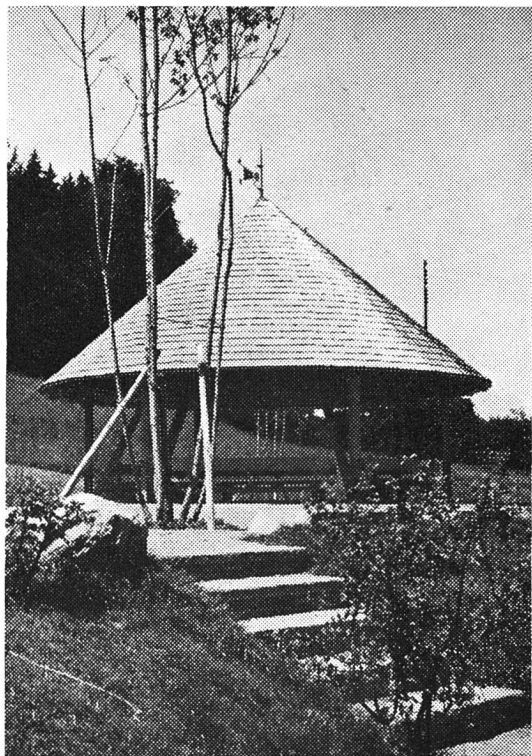
Ein pagodeartiges Rondell bietet Schutz vor Regen und Sonne

An einer durch verschiedene prominente Behördemitglieder, Stadtbaumeister, Künstler, Donatoren und Genossen-