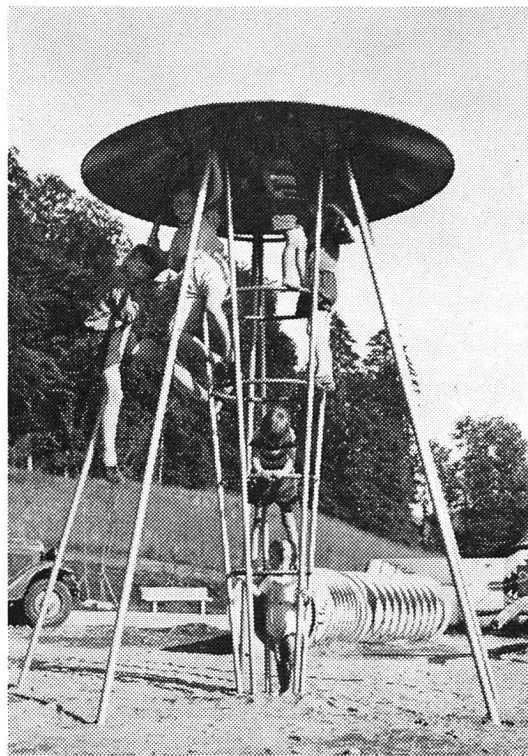
Der «Altra»-Kletterturm ist ein begehrtes Betätigungsobjekt

Verfügung stellen. In ungefähr tausendstündiger Arbeit wurde unter der Leitung der Architekten A. Trachsel und P. Reinhard, Präsident der BGS, die vollständige Planierungsarbeit durchgeführt. In dieser Fronarbeit aber liegt der tiefere ethische Wert dieses Kinderspielplatzes, denn dadurch sind manche Genossenschafter sich auch menschlich nähergekommen. Sie haben durch dieses Freizeitopfer den Beweis erbracht, daß auch in unserm materialistischen Zeitalter noch ein starkes Stück echten Gemeinschaftsgeistes vorhanden ist.