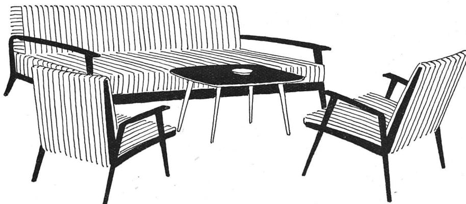
Bild rechts: Bei aller Modernität und Eleganz soll nie der Endzweck des Polster- sessels vergessen werden: Behaglichkeit und Entspannung zu vermitteln

Bild links: Bevorzugte Objekte für den tüchtigen Formgestalter sind die Polstermöbel