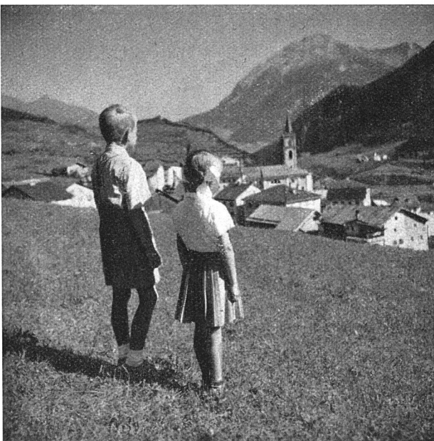
Reams. Blick gegen Lenzerheide