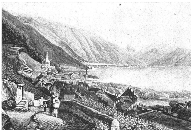
Montreux vor 100 Jahren (nach einem alten Stich)

In Montreux sind dagegen nur aus der Römerzeit zuverlässige Zeugnisse stehender Niederlassungen gefunden worden. So zum Beispiel eine Villa in Baugy , deren wertvolle archäologische Schätze seinerzeit auf wucherische Weise aufgekauft und durch Zwischenhändler im Laufe der zweiten Hälfte des 18. Jahrhunderts in alle Welt zerstreut worden sind. So ist denn fast nichts von alledem in unseren kantonalen und örtlichen Sammlungen verblieben.