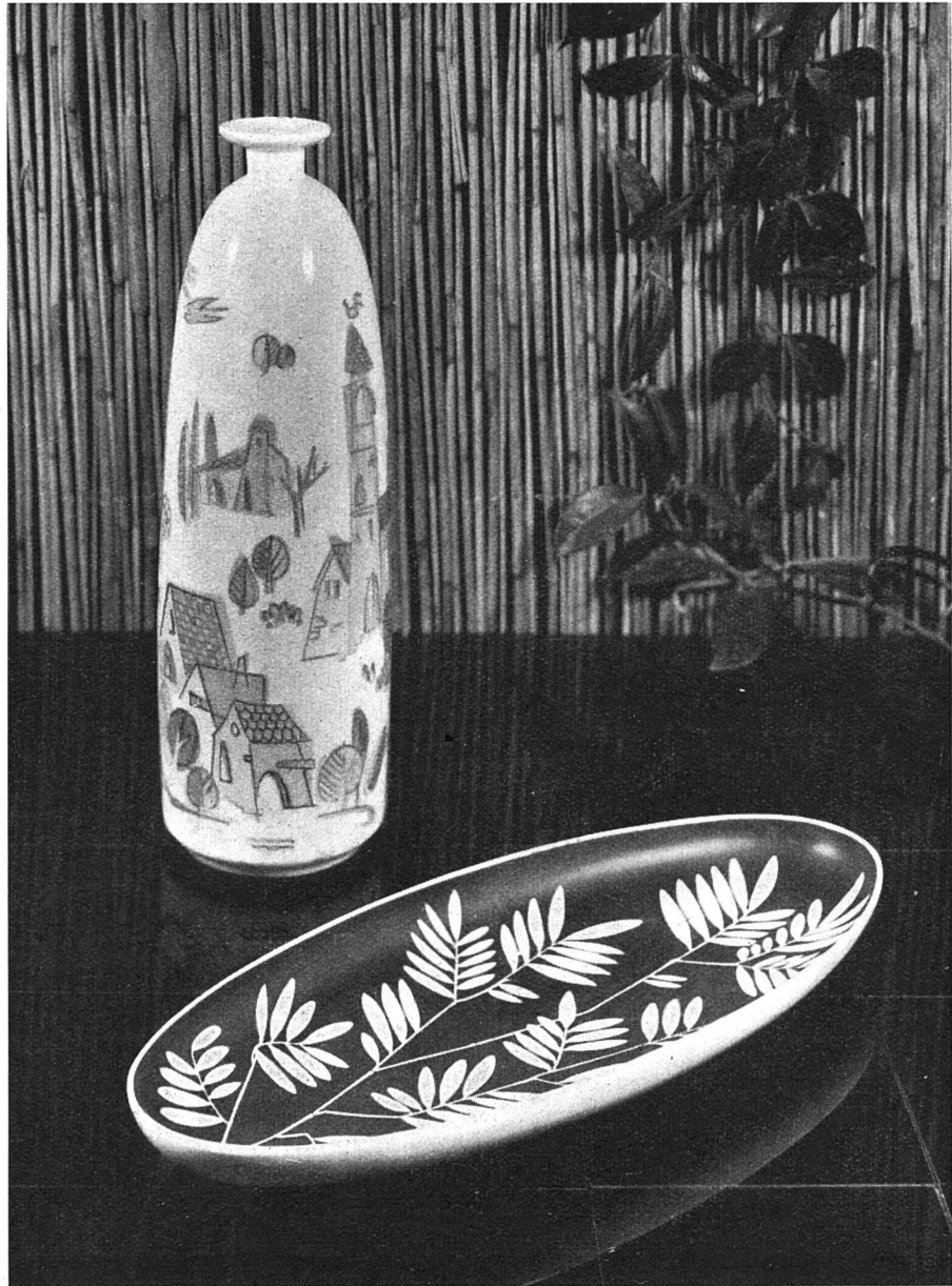
Bild 3 Zierporzellan, hergestellt in der Porzellanfabrik Langenthal AG. Wie herrlich wird sich ein einzelner blühender Zweig in der aparten Vase ausnehmen und wie passend die golden-gereifte Frucht in der schmalen Schale!