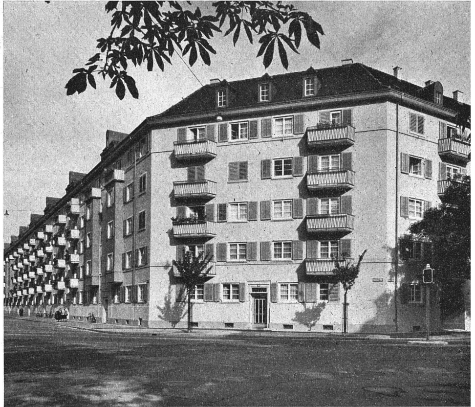
Die Fassade wurde in hellem Ton, Erker, Dachablaufrohr und Balkongeländer in dunklem Ton gehalten.