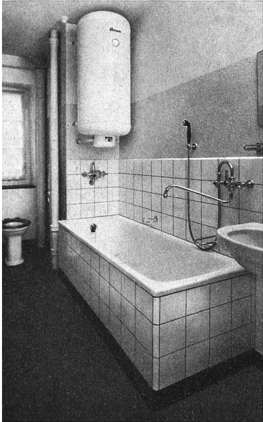
Die Badzimmer erhielten eingebaute Stahlbadwannen, Lavabos mit Zubehör und einen 100-Liter-Elektroboiler, der auch das Warmwasser für die Küche liefert. Ein Teil der Badzimmer erhielt die sogenannte Asig-Batterie, die für Wanne und Lavabo dient. Dadurch konnte die Vergrößerung des Wasserstranges umgangen werden.

Da keine Räumlichkeiten für die Heizungsanlage vorhanden waren, mußte dieselbe im Hofe unterirdisch erstellt werden. Die nach den Bauarbeiten vorgenommene Neugestaltung der Grünanlage wurde durch diese Disposition nicht beeinträchtigt. Die Heizungsraumlichkeiten sind ebenerdig gebaut und ragen nicht über das Terrain der Grünanlage hinaus. Die Erstellung der Zuleitungen zu den Häusern und daselbst zu den Wärmeradiatoren in den Wohnungen bereitete keine nennenswerten Schwierigkeiten, ebensowenig die Montage der Radiatoren in den Wohnräumen.