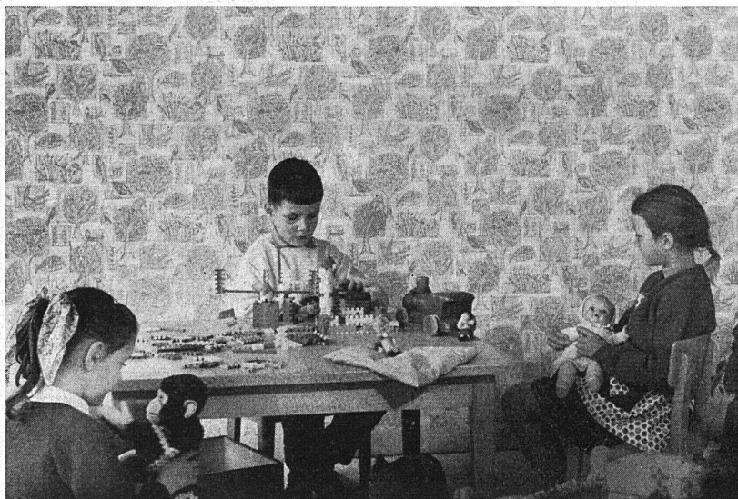
Eine fröhliche, abwaschbare Tapete im Kinderzimmer ist mitbestimmend für die Atmosphäre im Reich der Kinder. (Aus der Galban-Kollektion.)