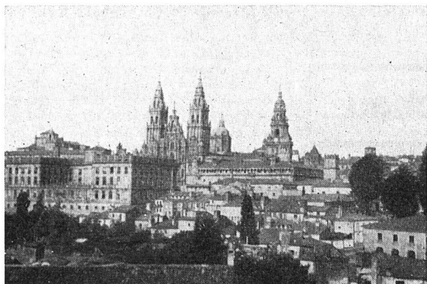
Santiago de Compostela