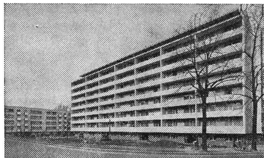
Wohnblock der Baugenossenschaft des Bundespersonals Basel, im Hintergrund Wohnblock der städtischen Pensions-, Witwen- und Waisenkasse an der Lindenhofstraße 33–39 in Basel. Total 82 Wohnungen mit 284 Zimmern, ferner eine unterirdische Einstellhalle für Post- und Privatfahrzeuge. Heizung und Warmwasserversorgung im Winter durch eine koksgefeuerte Blockheizung.

Als Musterbeispiel einer modernen Koksblockheizung darf die Wärmezentrale der Baugenossenschaft des Bundespersonals Basel und der Städtischen Pensions-, Witwen- und Waisenkasse Basel an der Lindenhofstraße 33–39 gelten (siehe unsere Bilder). Total 82 Wohnungen mit 284 Zimmern sowie eine große unterirdische Einstellhalle für Post- und Privatfahrzeuge sind an die koksgefeuerte Blockheizung angeschlossen, auch die zentrale Warmwasserversorgung.