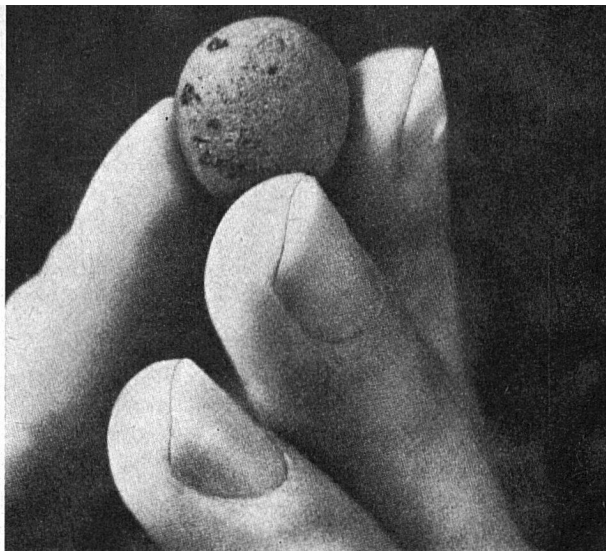
Einzelnes Leca Korn

Im Einlaufteil des Ofens wird zunächst der Ton getrocknet, während im Auslaufteil des Ofens der Ton gebläht und gebrannt wird. Die beim Brennprozeß entstehenden Abgase durchstreichen den Einlaufteil des Ofens und trocknen dort auf wirtschaftliche Weise den Ton. Eine weitere wichtige Funktion des Einlaufteiles besteht in der Verformung des Tones zu Granalien. Im Auslaufteil des Ofens erfolgt das eigentliche Brennen der Leca Körner. Die getrockneten Tongranalien werden bis auf eine Temperatur erhitzt, in welcher