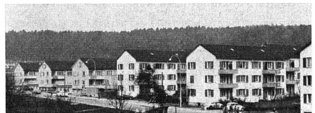
Wohnhäuser der HGW an der Seuzacherstraße

Bereits 1961 wurde ein Baugesuch für das restliche Areal eingereicht. Leider lehnte der Stadtrat eine dritte Ausnahmebewilligung für eine dreigeschossige Überbauung ab. Der Vorstand war gewillt, verschiedene Konzessionen in bezug auf Festsetzung der Mietzinse usw. freiwillig einzugehen. Trotzdem wurde eine weitere Ausnahmebewilligung abgelehnt. Die Gebrüder Thoma, Architekten, Winterthur, welche bereits die