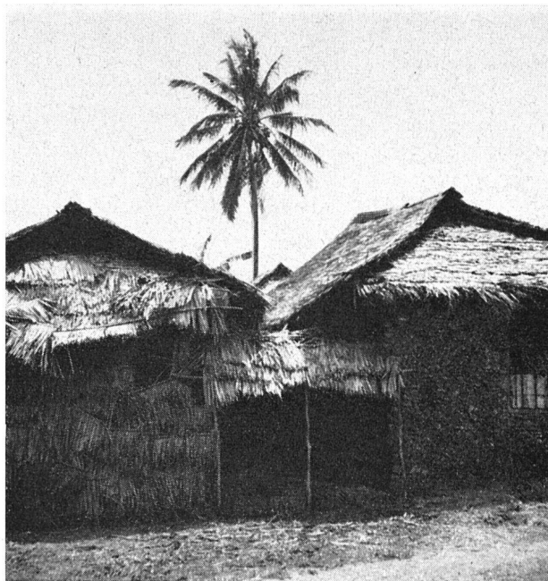
Zu unseren Bildern:

Auf Grund seines sehr ausgeprägten Gerechtigkeitsgefühls ist er sehr schnell beleidigt und fühlt sich verspottet. Der Afrikaner hat jedoch einen sehr großen Sinn für Humor, ist schnell zu fröhlichem Unfug bereit. Es ist ein Vergnügen zu