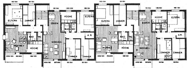
Grundriß Hinterberg, allgemeiner Wohnungsbau