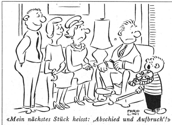
«Mein nächstes Stück heisst: „Abschied und Aufbruch!“»