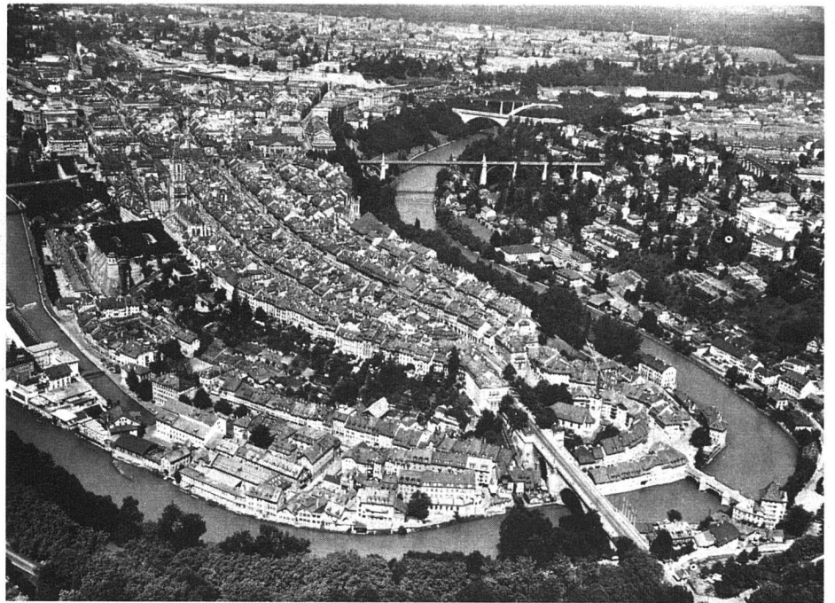
Das alte Bern, ein Meisterwerk mittelalterlichen Städtebaus, zugleich Mittelpunkt und Kernstück einer modernen, aufgeschlossenen Stadt.

Das Charakteristische dieser Strassen im Stadtkern ist, dass sie auf beiden Seiten von «Lauben» begleitet sind, Bogenhängen, die in die Häuserfassaden hinein gelegt sind, wie die portici der italienischen Kleinstädte. Die Strasse gehört dem Fahrverkehr; der Fussgänger durchwandelt die Lauben. Trockenen Fusses kann er, auch beim schlechtesten Wetter, die ganze Stadt durchqueren. «Läubeln» nennt es der Berner, wenn er, langsam und behaglich, diese luftigen