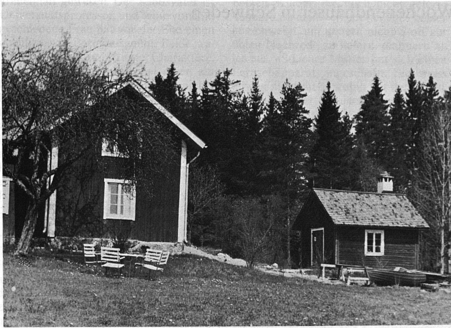
Landarbeiter-Häuschen aus dem Jahre 1750. Diese alten Häuser werden besonders gerne von ehemaligen Landbewohnern als «Sommerhäuschen» gekauft. Die Dächer sind mit Kirchholzschildeln gedeckt. Beim Kauf sind vielfach noch die uralten Haus- und Gartengeräte vorhanden.

ist, oder es wird das im Überfluss vorhandene Brennholz, meistens aus eigenem Waldbestand oder vom benachbarten Bauern, im Kamin verbrannt. Die Wasserversorgung ist in der Regel durch eigene Felsbrunnen gesichert, die oft fünfzig bis sechzig Meter tief gebohrt sind.