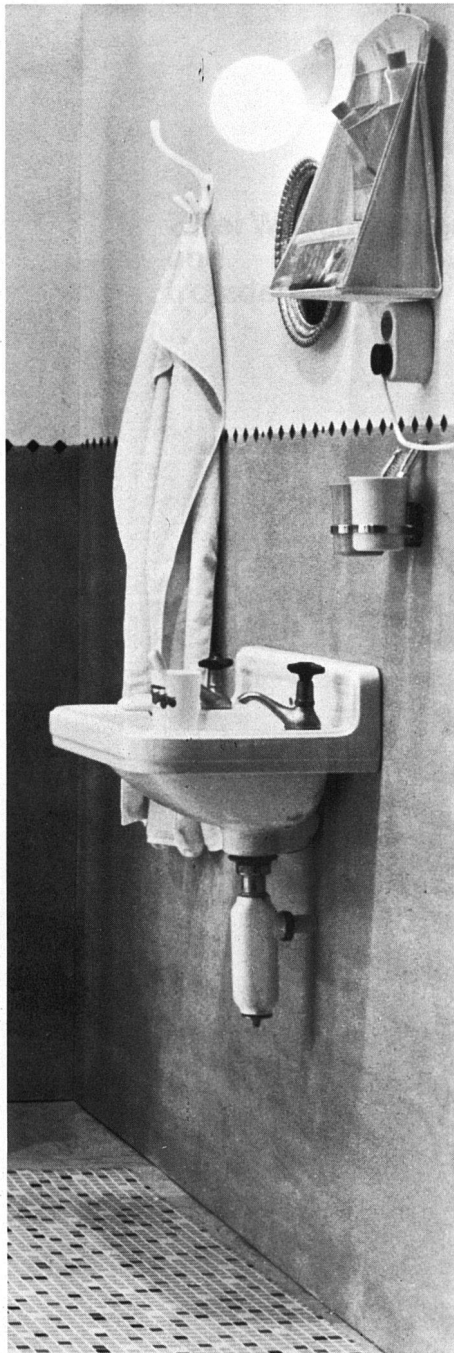
Unsere Photos auf dieser Seite: Primitive und veraltete Badezimmer und Toilettenräume findet man noch immer. Sie werden aber zusehends seltener – zum Glück. Das wohnliche und darum gerne benützte Badezimmer – Bild unten – wird zur Selbstverständlichkeit.

an Zweckmässigkeit durch die richtige Auswahl.