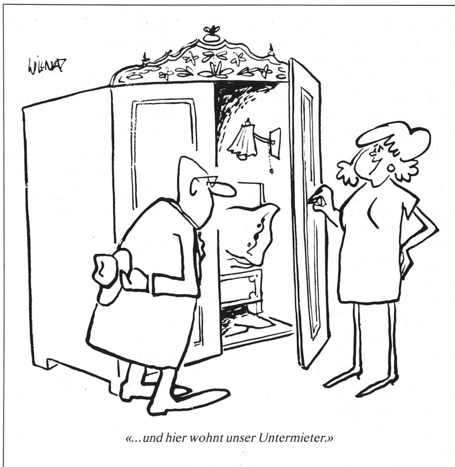
«...und hier wohnt unser Untermieter.»

Das sorgfältig zusammengetragene und teils selbst angefertigte Bildmaterial ist ein integrierender Bestandteil des Textes und ergänzt überdies in hohem Masse die schon bestehenden Untersuchungen über die Kunstdenkmäler des Kantons Graubünden.