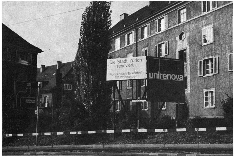
Renovieren statt demolieren: Siedlung Birkenhof

Nachdem sogar auf eidgenössischer Ebene dem Problem der Erhaltung von Wohnsubstanzen mit Recht sehr grosse Bedeutung zugemessen wird, mutet es