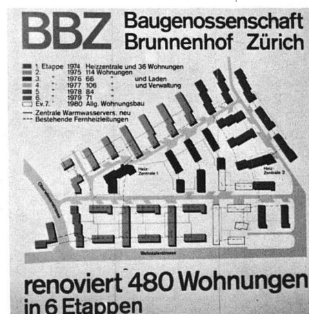
Etappenweise Modernisierung eines baugenossenschaftlichen Quartiers: 480 Wohnungen werden wieder zeitgemäss und attraktiv

Die Zeit spricht nur zu deutlich dafür, dass mit volkswirtschaftlichen Werten nicht mehr so verschwenderisch wie bisher umgegangen werden darf.