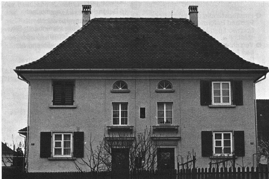
Unsere Photos zeigen Ausschnitte aus der Siedlung in Romanshorn vor und nach den Renovationsarbeiten.