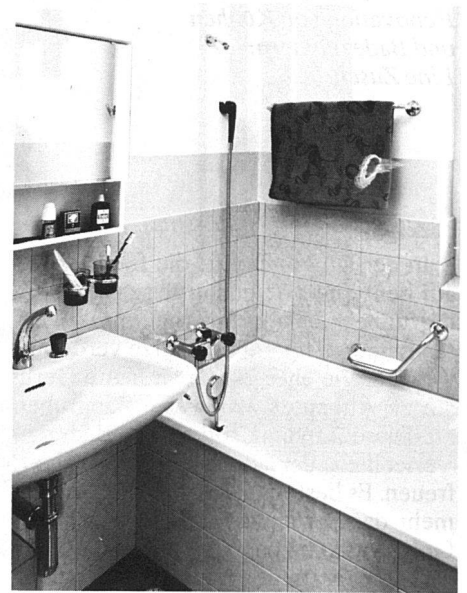
...und nach vollendeter Renovation

gesamte Heizungssystem überholt und zur zentralen Warmwasseraufbereitung ausgebaut.