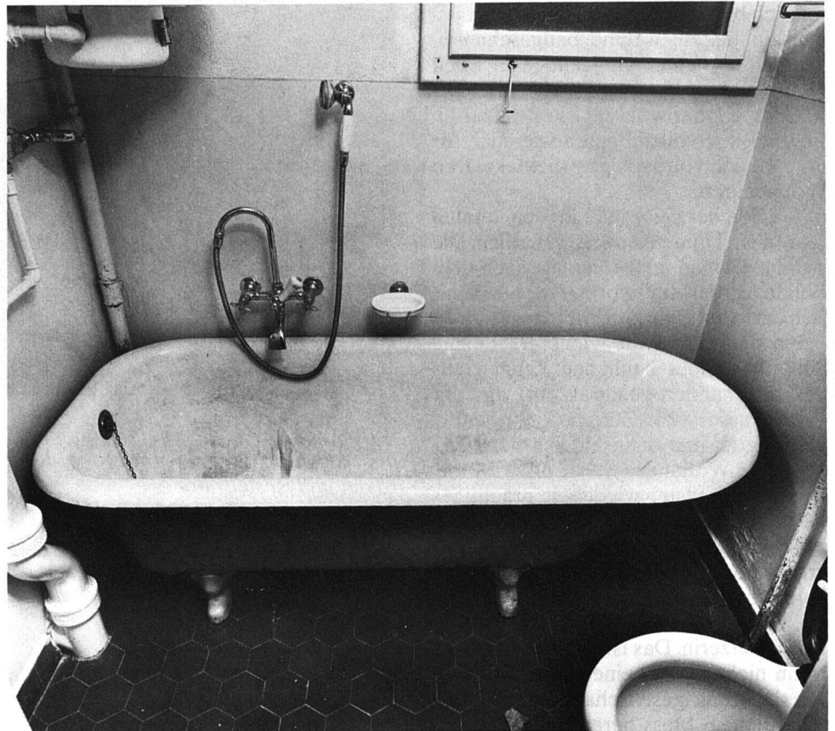
Altbaumodernisierung in der Schweiz, einer grossen Wohnsiedlung, vor und nach der Gesamtrenovation.

Die Alternative zur baulichen Erneuerung ist in der Regel nur die Vernachlässigung von Bauten, die früher oder später zur Verslummung von ganzen Nachbarschaften, Strassenzügen oder gar Quartieren führt. Erneuerungen und Modernisierungen sind daher nicht einfach ein Rettungsanker für das Baugewerbe, sondern stellen eine soziale, wirtschaftliche und kulturelle Daueraufgabe dar.