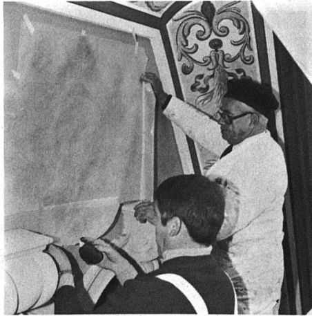
Aufpausen des teilweise abgenommenen und teilweise ergänzten Motivs durch Maler und Restaurator

Die Untersicht des Giebels wurde aufgrund einer Fotografie des baugeschichtlichen Archivs der Stadt Zürich