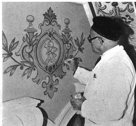
Das fertig ausgemalte Motiv