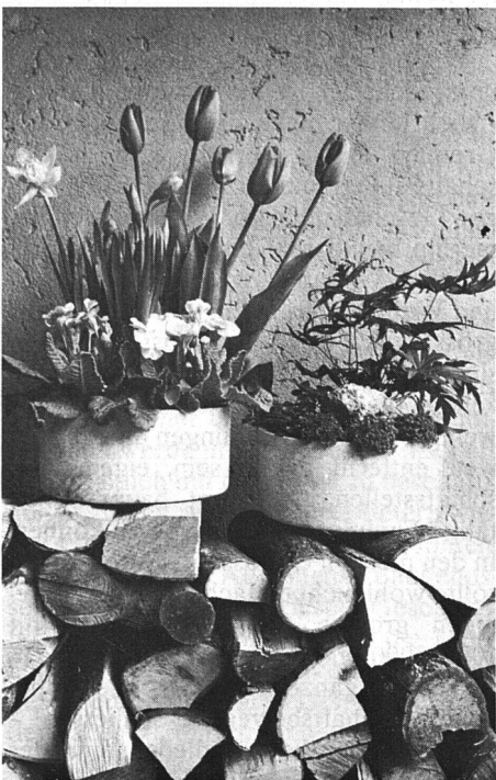
Im Handumdrehen kann man sich ein blühendes Frühlingsgärtchen vor die Haustüre stellen. Der prächtige Blütenflor setzt einen bunten Akzent neben die kleine Farnsammlung.

den Balkon, wo sie auch den Winter unbeschadet überstehen.