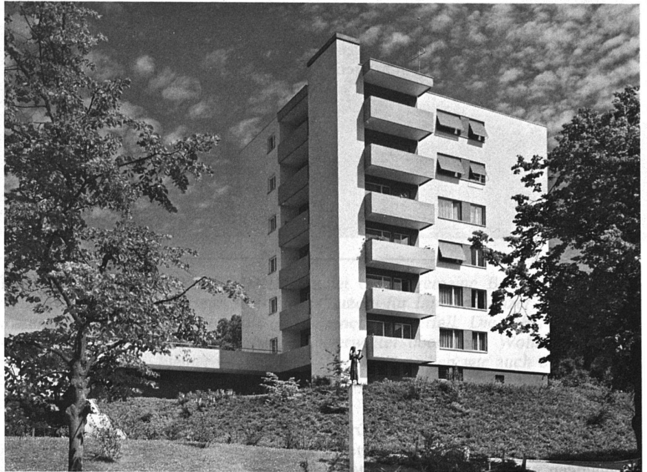
Bild rechts: Eisenbahner-Baugenossenschaft Luzern: Überbauung aus dem Jahr 1961, 4 Häu- ser zu je 14 Wohnungen.

Die Eisenbahner Baugenossenschaft Luzern baute in verschiedenen Wohnkolonien insgesamt 336 Wohnungen und ist damit die zweitgrösste Mitgliedgenossenschaft innerhalb der Sektion Inner-schweiz.