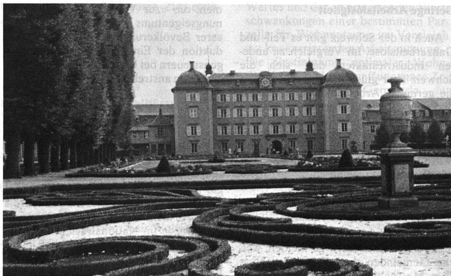
Ornamente aus Buchs und verschiedenfarbigem Kies, ein wichtiges Element der barocken Gartenkunst, mit Blick gegen das Schloss.

Neben den Einflüssen des grossen Versailles finden wir bereits schon ge-