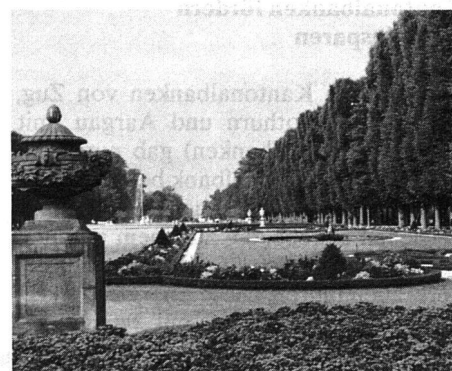
Ausblick auf die Längsachse des Gartens vom Schloss aus mit den prächtigen Linden-Alleen.

spielt die freie Natur zusammen mit der gezügelten Natur in Form von architektonisch verwendeten Pflanzen als Alleen, Hecken und ornamentale Blumenbeete; andererseits harmonisieren Pflanzen mit den vielen Skulpturen und Zierbauten.