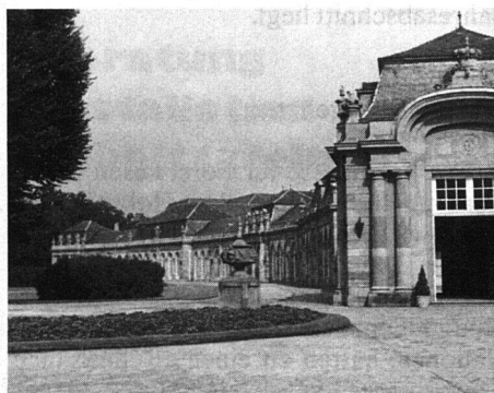
Einer der beiden Zirkelbauten, die den Kreis des Gartengrundrisses begrenzen. Hier befindet sich ein kleines Rokoko-Theater.