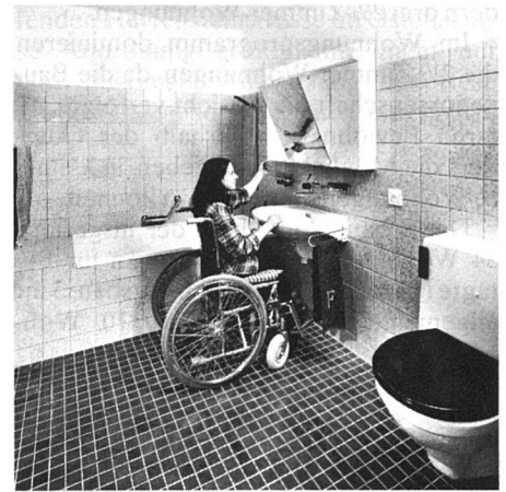
Badezimmer der Invalidenwohnungen