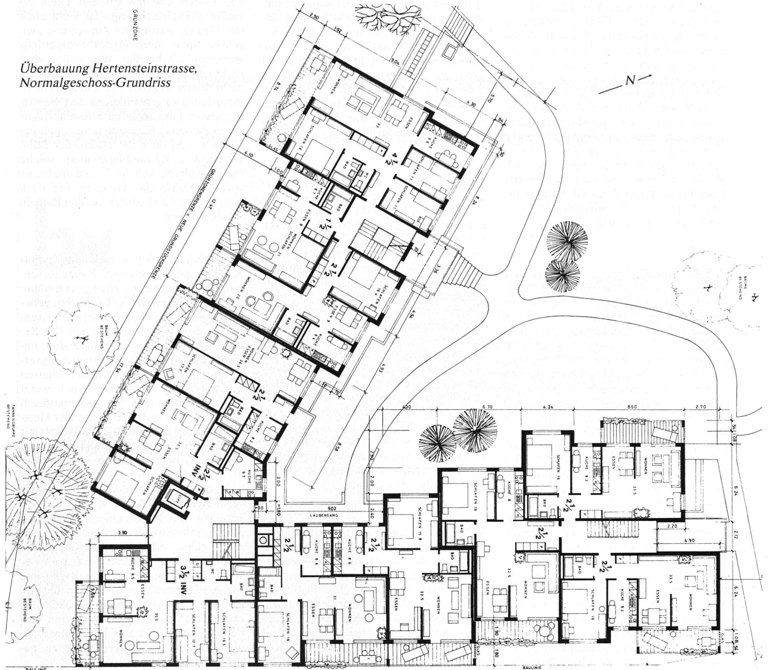
Überbauung Hertensteinstrasse, Normalgeschoss-Grundriss

Die Architekten suchten die Lösung in einem winkelförmigen Gebäude entlang der Grünzongrenze im Südwesten und der in spitzem Winkel zu ihr verlaufenden Hertensteinstrasse im Osten. Diese Anordnung ermöglichte nicht nur eine maximale Ausnützung des Restgrundstückes, sondern auch eine gross-