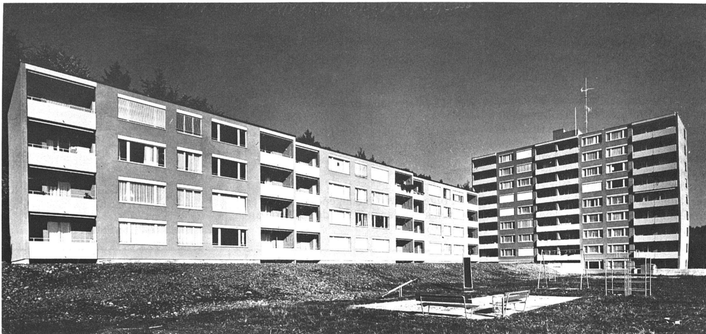
Siedlung «Grafenbuck» der Immobilien- genossenschaft Schaffhausen, Baujahr 1973/74. 58 Wohnungen, Kinderspiel- platz und Autoeinstellhalle.