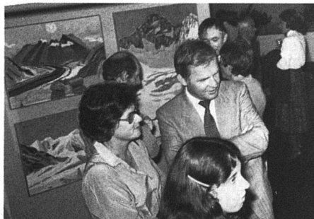
Arrivierte Künstler und Hobby-Künstler aus der Genossenschaft zeigen ihre Werke an vielbeachteten Ausstellungen.