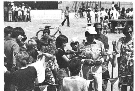
Schnappschuss vom Kinderspieltag am Genossenschaftstag.