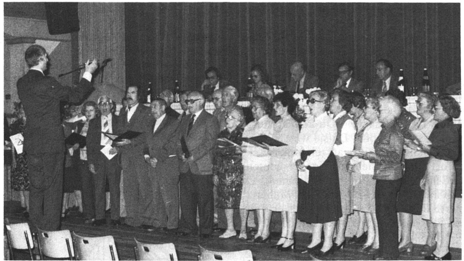
Der Genossenschaftschor eröffnet jeweils auch die Generalversammlung.

Die Grundlage einer Genossenschaft ist die freiwillige Vereinigung von Personen mit dem Willen zur Selbsthilfe. Es ist also für die Bau- und Wohngenossenschaft im Sinne der vorstehenden Überlegungen nicht damit getan, dass wir möglichst effizient bauen, renovieren, unterhalten und vermieten. Jede Zeit hat