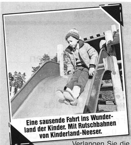
Eine sausende Fahrt ins Wunderland der Kinder. Mit Rutschbahnen von Kinderland-Neeser.

Unvernunft und Gewinnstreben lassen beispielsweise in Afrika Wälder kahl schlagen und in Südamerika tropische Wälder roden. Ein Teil des Holzes wird als modischer Möbelrohstoff nach Europa transportiert. Anderes wird an Ort und Stelle verbrannt, damit die Asche die geplanten Monokulturen düngen kann. Allzubald zeigt sich, dass solche massiven Eingriffe in die Natur das Land zerstören, im wahrsten Sinne des Wortes «verwüsten» und versalzen. Unheilvolle Klimaveränderungen sind die mittel- und langfristigen Schäden, unter denen Millionen von Menschen zu leiden und zu sterben haben.