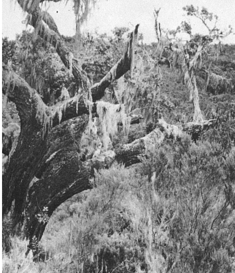
Baumriesen mit Bartflechten

Noch kletterte der Landrover einige Dutzend Meter höher, dann hatte der Pfad sein Ende, von da aus ging es nur noch zu Fuss weiter. Nach einer kurzen Rast griffen wir zu unseren schweren Rucksäcken und stiegen langsam bergan. Der Wald war voller Gerüche, modrig duftete es von altem Holz, dann wieder glaubte man den scharfen Geruch eines Kleinraubtieres wahrzunehmen. Allenthalben traf man auch auf frische Losung von Büffeln, auch die Spuren von Elefanten, die hier vorbeikamen, waren nicht zu verkennen. In den Wäldern am Meru lebt