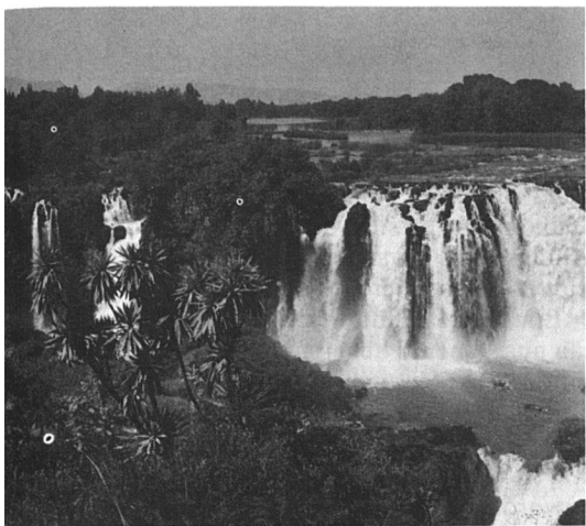
Die Tissisat-Fälle

nigt, fortzusetzen. Das Naturschauspiel der Tissisat-Fälle ist grossartig und demjenigen der Victoria-Fälle im südlichen Afrika ebenbürtig. Im Wasserstaub bildet sich ein traumhafter Regenbogen. Der halbstündige Anmarschweg zu den Fällen des Blauen Nils führt über eine alte Steinbrücke aus dem 17. Jahrhundert. In den Hütten am Wegrand leben einfache, freundliche Menschen, sie sind offensichtlich noch nicht durch den Tourismus verdorben. Der Ausflug zu den berühmten Wasserfällen wird auch