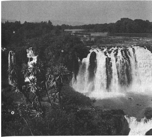
Die Tissisat-Fälle

Wer Kenia und Tansania bereist hat, ist überrascht, in Äthiopien ein völlig anderes Afrika vorzufinden: ein trockenes, sehr armes und überbevölkertes Land. Mehr als 32 Millionen Menschen leben auf einer Landfläche von 1 235 000 km 2 , mehr als die Hälfte der Einwohner Äthiopiens ist unter 20 Jahre alt.