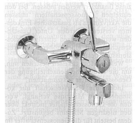
Badebatterie arwa-trend GL: Schwenkauslauf mit beweglichem Brauseabgang

Für problemlose Benützung durch Kinder und ältere Personen ist eine Höchsttemperatur-Limitierung sowohl für den Wannen- wie den Brauseabgang unumgänglich. Bei arwa-trend GL-Mischern wird die Mischwassertemperatur auf einfache Weise limitiert, ohne Absperrung der Wasserzufuhr und ohne Spezialwerkzeuge. Wesentlich ist, dass es sich nicht um komplizierte Sondermassnahmen, sondern um Standardarmaturen handelt.