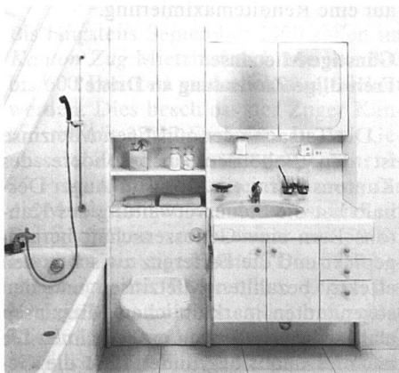
Nur Fachleute wissen, dass sich in diesem praktischen Badezimmermöbel...

Je mehr Schreiner-, Maurer- und Gipserarbeiten bei einer Badezimmerrenovierung anfallen, desto länger dauern die unangenehmen Immissionen und Benützungsbegrenzungen und desto teurer wird sie. Die wichtigsten Sanitärgrössen der Schweiz haben sich deshalb bemüht, diesen Problemen mit geeigneten Renovierungssystemen abzuwehren.