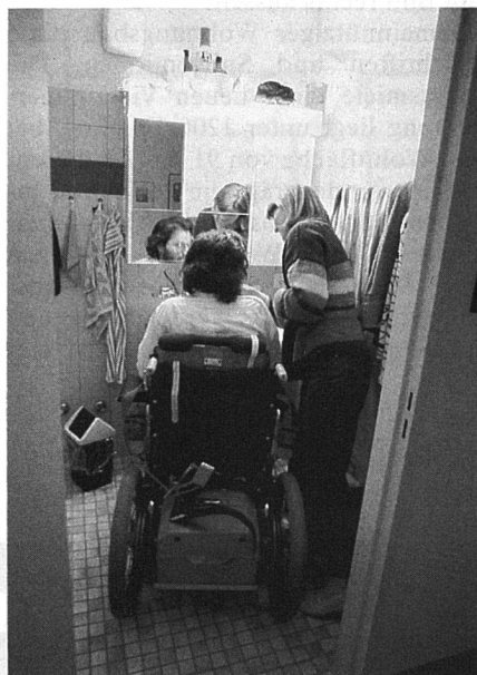
Richtige Einteilung des Sanitärraumes ist ohne Mehrkosten erreichbar