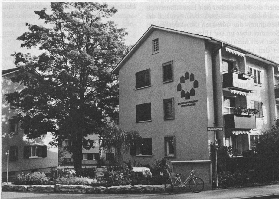
Ausschnitt aus der Überbauung am Wydäckerring

Ihnen übergeordnet ist der Vorstand mit 9 Mitgliedern.