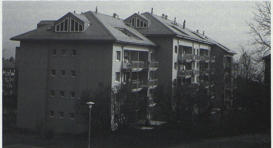
Das frisch renovierte Gebäude der Gewerbebaugenossenschaft in Horgen. In den Dachstöcken konnte je eine geräumige 3 1/2-Zimmer-Dachwohnung zusätzlich errichtet werden: Ein gutes Beispiel für eine sanfte Verdichtung des Wohnraumes in bereits überbautem Gebiet.

Bevor mit der eigentlichen Planung begonnen wurde, stellte man sich die Frage nach der kommenden Nutzung: Welchen stimmt der Komfort mit den Bedürfnissen der Mieter überein, hat die Gesamtgestaltung noch Gültigkeit? Die Antwort auf