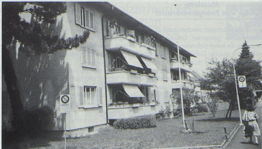
Schluss von Seite 10

Vermietet wird der Wohnraum in allen europäischen Ländern hauptsächlich von Privaten oder Genossenschaften mit Aus-