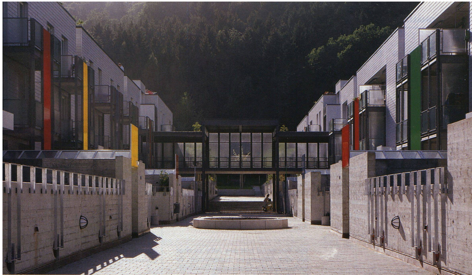
Im oberen Arealteil der Siedlung «Schleipfe» in Spreitenbach überspannt ein Quertrakt die Siedlungsachse.