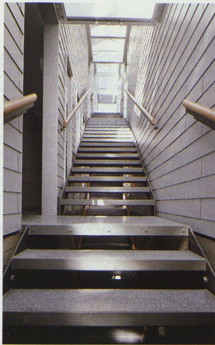
Die innere Erschliessung der Gebäude erfolgt über halbgesschossig versetzte Wohnungszugänge, die über ein Oberlicht natürlich belichtet sind.