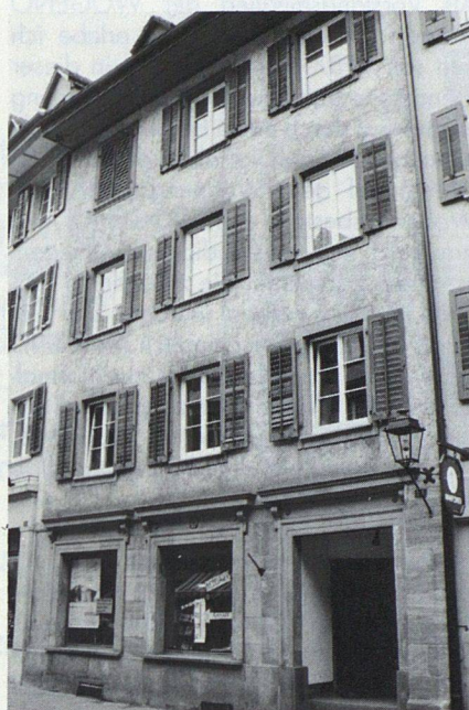
Marktgasse 23, Rheinfelden: 3 Wohnungen, 1 Laden mit Büro

te zahlen zu müssen und aktiv am bevorstehenden Umbau der Liegenschaft mitwirken zu können. «Mitbestimmung» hiess dann aber in Wirklichkeit auch: Zahlreiche Sitzungen mit dem Architekten und den Handwerkern, Planungs-Leerläufe, endlose Verzögerungen beim Umbau (und damit verbunden eine erhebli-