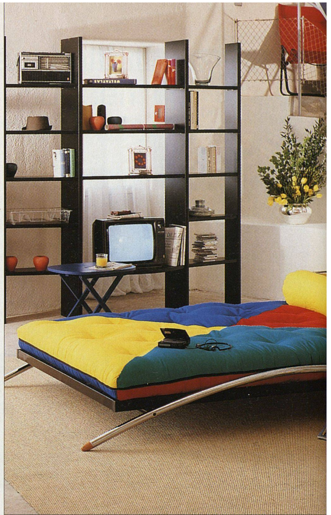
«Swing»: Poppiges Outfit für den guten, alten Lattenrost.

ERHOLEN Bei allen Wohnmöglichkeiten rund ums Bett: Es ist doch nirgends so nett wie drin. Schlafend ver-