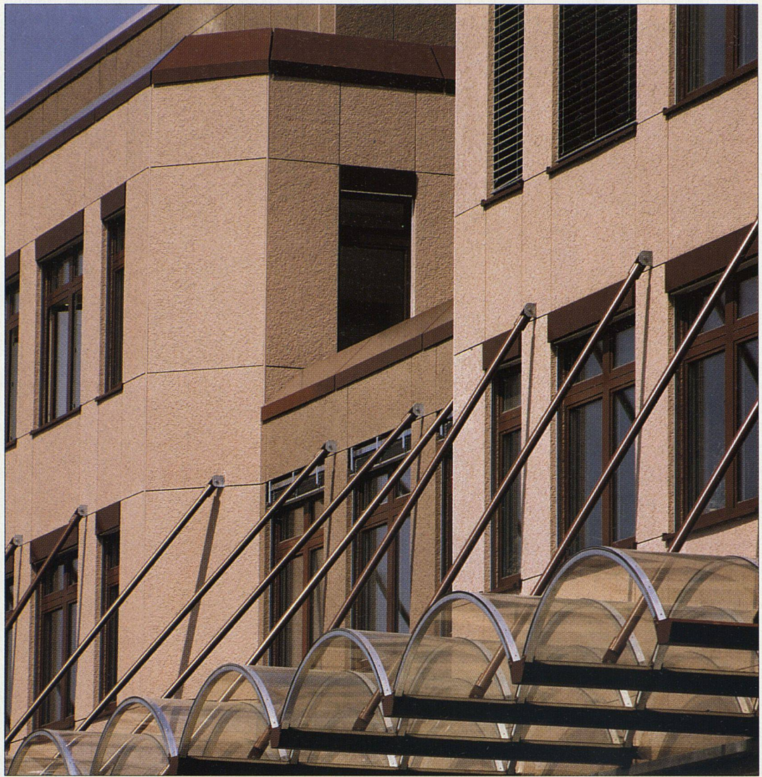
Grossformatige CEMFOR-Fassadenplatten am Neubau der WALIM AG, Brüttsellen/ZH Bauherrschafft: WALDER Immobilien, Brüttsellen/ZH. Ausführung: Locher & Cie. AG, Zürich, Bauunternehmung

lassen sich grundsätzlich zwei Bautypen unterscheiden: die Kompaktfassade (Aussendämmsystem) und die vorgehängte hinterlüftete Fassade. Beide lassen sich sowohl im Neubau als auch für Sanierungen einsetzen.