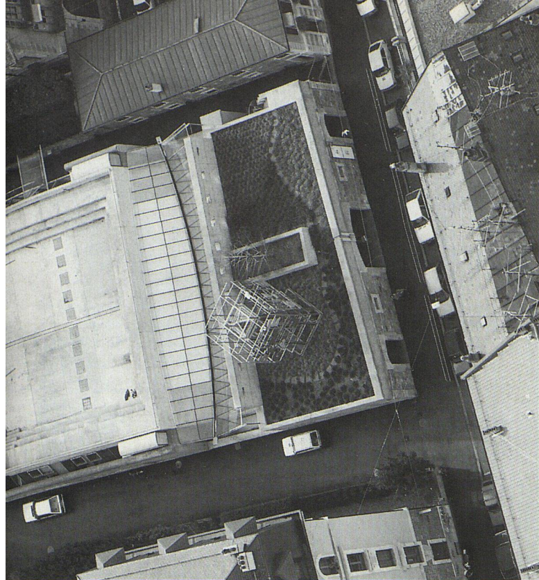
Le théâtre Am Stram Gram à Genève

Le théâtre lui-même occupe l'emplacement de l'ancien verger et du hangar qui borde la route de Frontenex. Il est installé à l'intérieur des murs de cet espace vert. On entre dans le théâtre par ce hangar, puis on descend vers le verger... souterrain. En effet, quand on arrive dans le foyer au deuxième sous-sol, on découvre deux orangers, qui sont comme des arbres tombés de l'ancien verger.