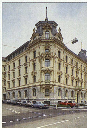
Haus Washington in St. Gallen: Verglasung mit optimaler Wärmedämmung und Schallschutz.

dernsten auf der ganzen Welt steht beim Stammsitz der Glas-Trösch-Gruppe im oberaargauischen Bützberg. Auf ihr werden die bekannten Silverstargläser beschichtet. Speziell für den Einbau im Modernisierungssektor eignen sich Wärmeschutzgläser mit eingebauten Sprossen. Die im