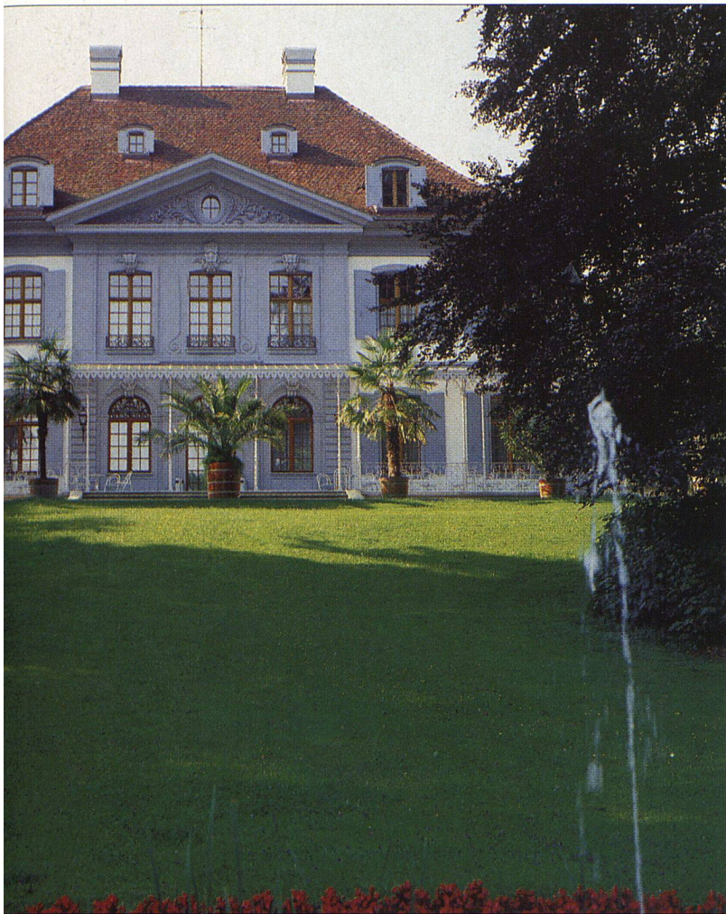
Es muss nicht gleich ein Schloss sein, aber die sorgfältige Wahl einer geeigneten Verglasung bietet Gewähr für eine gute Wärmedämmung und für mehr Behaglichkeit (im Bild: Schloss Ebenrain in Sissach, Baselland).

Luftzwischenraum eingebauten Sprossen, die in verschiedenen Farben und Querschnitten erhältlich sind, rekonstruieren die ursprüngliche Fenstereinteilung, ohne die Funktion des Isolierglases zu beeinflussen. Zudem, und das wissen vor allem die Hausfrauen zu schätzen, wird die Reinigung eines solchen Fensters erheblich vereinfacht. Im Isolierglas eingebaute Sprossen vermögen jedoch nicht allen ästhetischen Bedürfnissen zu genügen. Bei gewissen Lichtverhältnissen können sie beim Betrachten unter sehr spitzem Winkel praktisch verschwinden. Für anspruchsvolle Objekte, etwa in historischen Ortskernen, sind deshalb andere Systeme vorzuziehen. Zum Beispiel eine auf der Aussenseite vor das Isolierglas vorgesetzte Einfachverglasung mit konventionellen Sprossen. Selbstverständlich können auch Sprossenisoliergläser mit Zusatzfunktionen wie Schallschutz und Sicherheit ausgerüstet werden. Dort, wo unsere lärmige Umwelt zu einem Problem wird, und dies ist bei Renovationsobjekten oftmals der Fall, kann durch den Einbau von speziellen Lärmschutzisoliergläsern die Situation entscheidend verbessert werden.