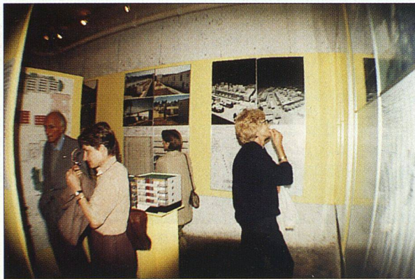
Gute Besucherzahl in der Ausstellung «Standard contra Innovation».

Daneben hat die Dame SVW auch körperliche Gebrechen. Sie leidet an der Überalterung ihres Wohnungsparks, ein Begriff, der ihr in St. Gallen beigebracht wurde. Die Häuser werden alt und wollen erhal-