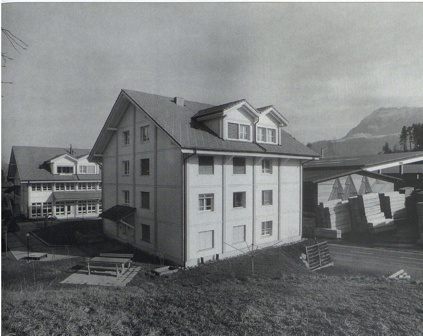
Preisgünstige Holzhäuser in Küssnacht am Rigi. Wer ein solches Haus erstellen will, braucht wegen aufwendiger Brandschutzkonzeptes sehr viel Geduld.