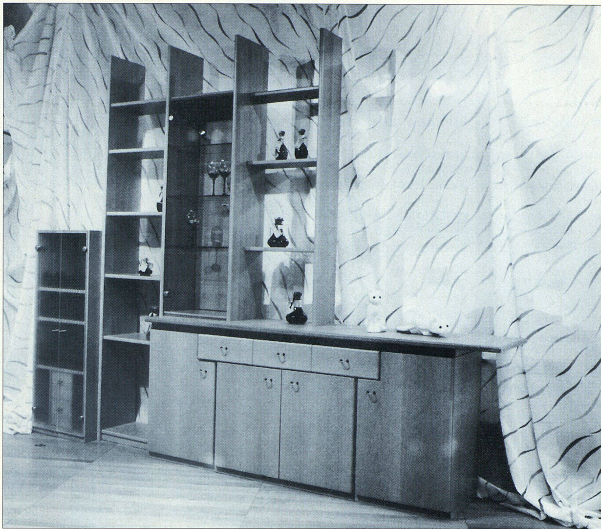
Mit frei kombinierbaren Möbelsystemen ist die Realisation von persönlichen Wünschen kein Problem mehr.