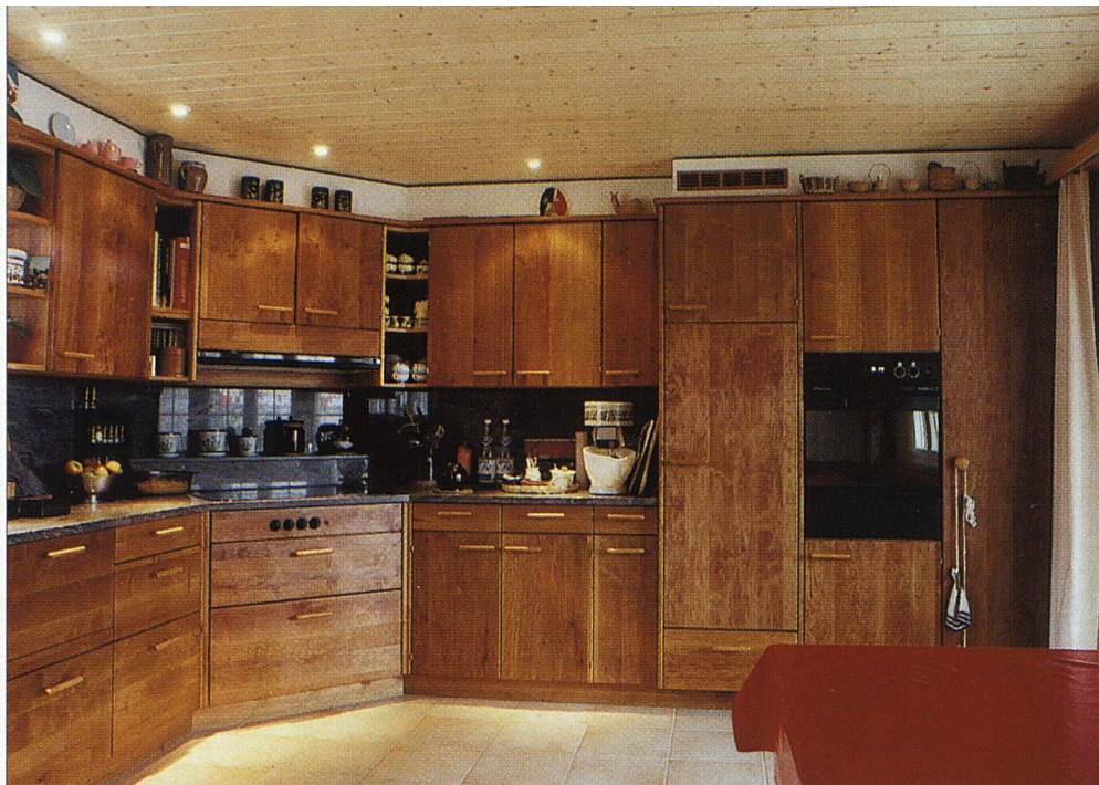
Wohnküche mit glatter Erlenholzfront: komfortabel und benutzerfreundlich.

Dobler verwendet bei seinen Produkten weder Kunstharzplatten noch kunstharzbeschichtete Elemente. Das Innere der von ihm kunstvoll in Handarbeit gefertigten Bio-Küchen besteht in der Regel vorwiegend aus einheimischem Tannenholz, die Aussenfronten wiederum werden speziell nach Kundenwünschen gefertigt. Bei der Wahl der Küchen-Aussenfronten bietet sich ein breites Spektrum an Möglichkeiten an, so beispielsweise gestemmte oder glatte Fronten, Weichholz- oder Hartholz-Fronten usw. Die kostengünstigsten Hölzer sind Buche, Tanne, Föhre, Lärche oder Eiche; als helle Hölzer gelten Ahorn, Erle, Esche, Birke. Bezüglich der verwendeten Schubladen und Türgriffe bieten sich ebenfalls verschiedenste Möglichkeiten. Kirschbaum-, Birnbaum- und Apfelbaumholz werden von Küchenästhet/innen gewählt; auch Kastanie wird vielfach bevorzugt, Nussbaum- und Ulmenholz gelten als exklusive Hölzer.